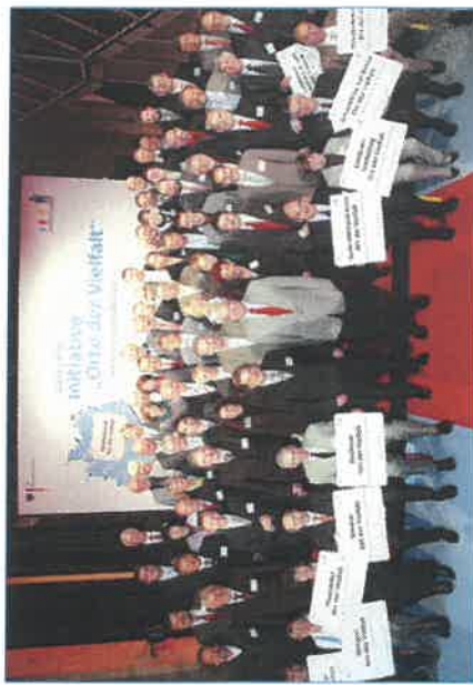
Am 23. September 2008 wurden die ersten 66 „Orte der Vielfalt“ ausgezeichnet.

Die aktuelle Bewerbungsfrist erfahren Sie unter: www.orte-der-vielfalt.de